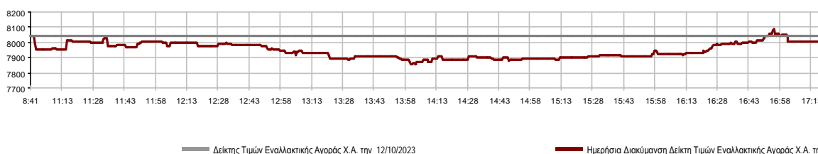
Ημερήσια Διακύμανση Δείκτη Τιμών Εναλλακτικής Αγοράς Χ.Α.