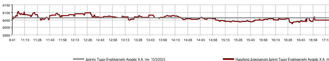
Ημερήσια Διακύμανση Δείκτη Τιμών Εναλλακτικής Αγοράς Χ.Α.