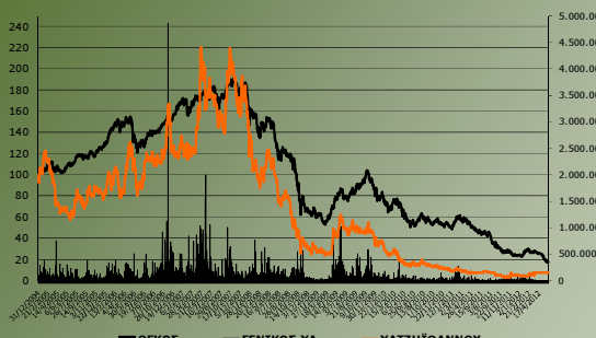
ΧΑΤΖΗΪΩΑΝΝΟΥ ΑΒΕΕ vs ΓΕΝΙΚΟΣ ΔΕΙΚΤΗΣ ΧΑ

Η μετοχή της εταιρείας είναι σε αναστολή διαπραγμάτευσης από τις 30.03.2012